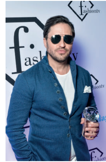
"Самый стильный певец" - Артур Пирожков;