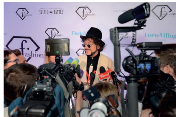
"Рекорд года" - шоу "Я" - Филипп Киркоров;