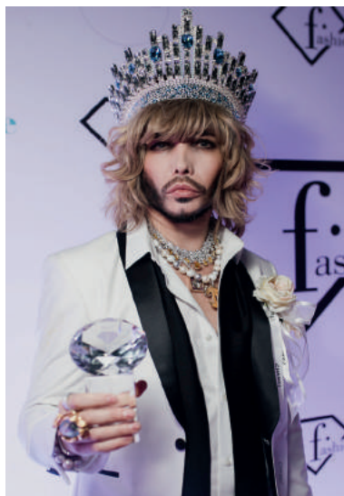
"Друг Fashion TV" - Сергей Зверев;