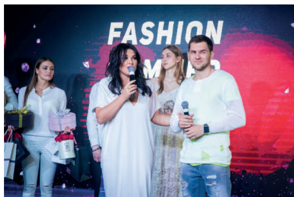
"Дуэт года" - Ирина Дубцова и Леонид Руденко;