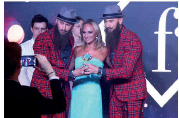
"Лучший DJ проект" – "S-BROTHER-S";